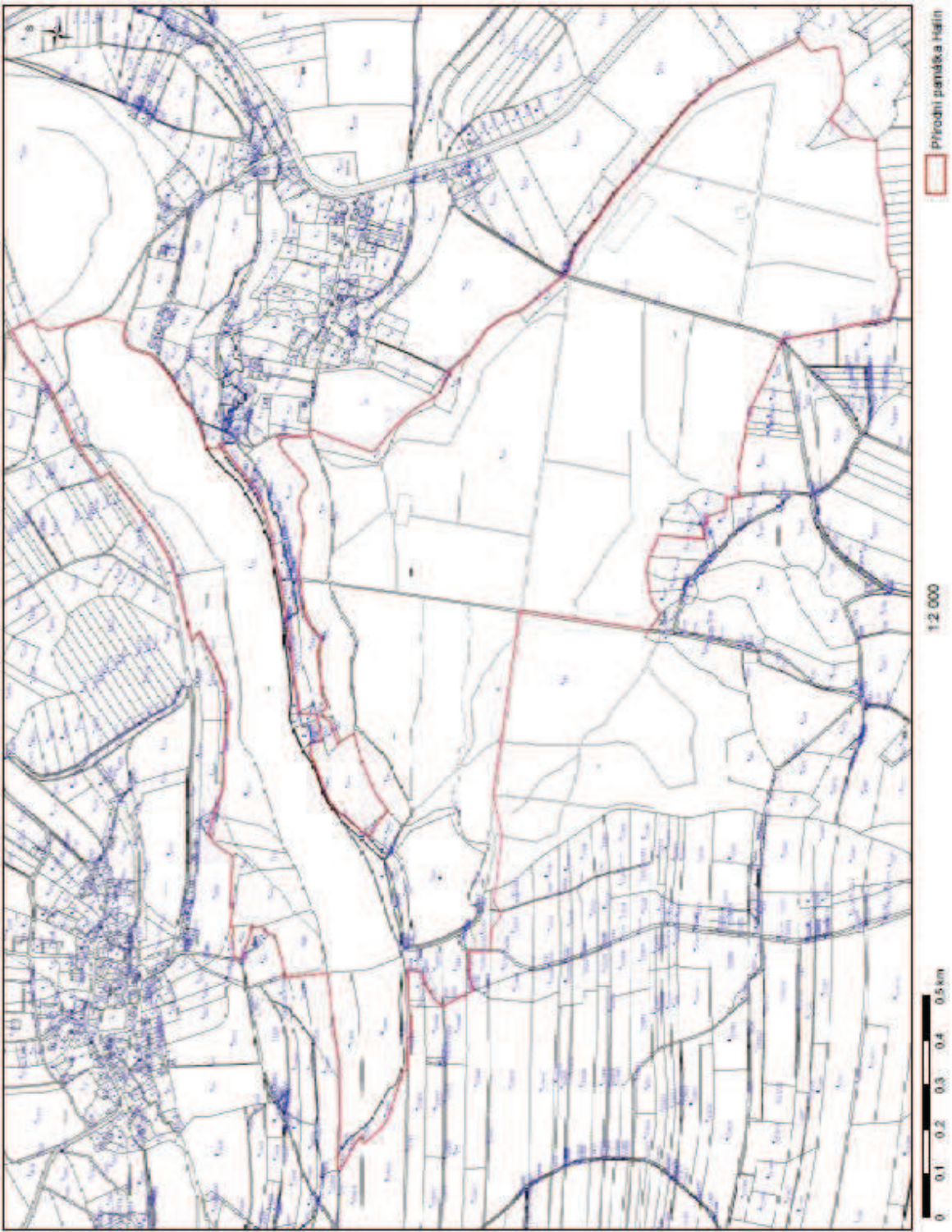
Príloha č. 2 - Katastrálna mapa se zákresem PP Hain.